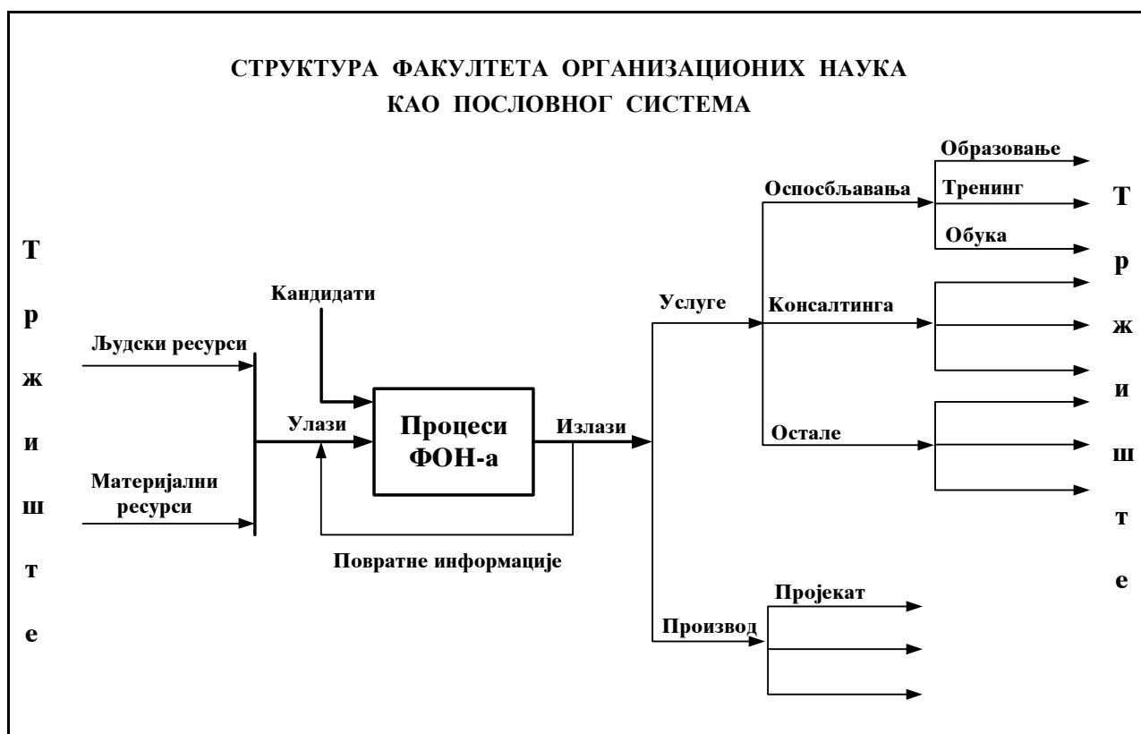
Слика 1. Структура Факултета као пословног сиситема

Факултет организационих наука као пословни систем, треба целокупан рад, пословање и одрживи развој да заснива на системском и процесном приступу – слика 1. То, поред осталог, подразумева адекватну структуру Пословног система, функционалну међузависност и повезаност свих елемената структуре, добру дефинисаност екстерних и интерних излаза и улаза, адекватно препознате процесе и дефинисан процесни модел, ресурсну подршку процесима, ваљану основу за управљање процесима, ресурсима и организационим целинама итд.